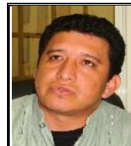
Jefe de la Oficina Operadora

La dirección de la Oficina Operadora es calle Independencia número 5, colonia Adolfo Ruíz Cortínez, C.P. 93166, Coatzintla, Ver., y cuenta con el sitio web http://187.174.252.244/caev/Oficinas_Operadoras/Coatzintla/ .